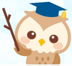
不動産のふくろう博士

Q. 別居している夫名義の家に住んでいます。夫は私が住んでいても家の売却は可能なのでしょうか？